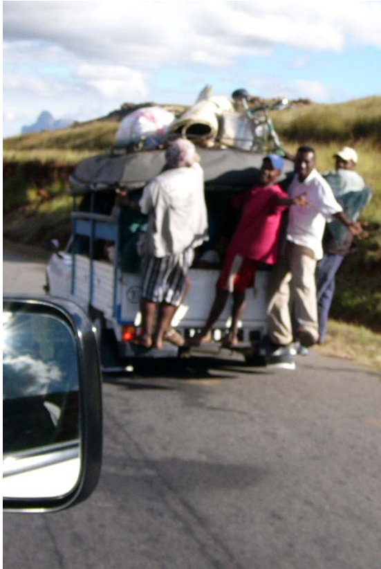
Hier hat es noch freie Plätze!