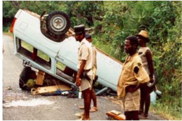
...in der Nacht sind keine Seltenheit