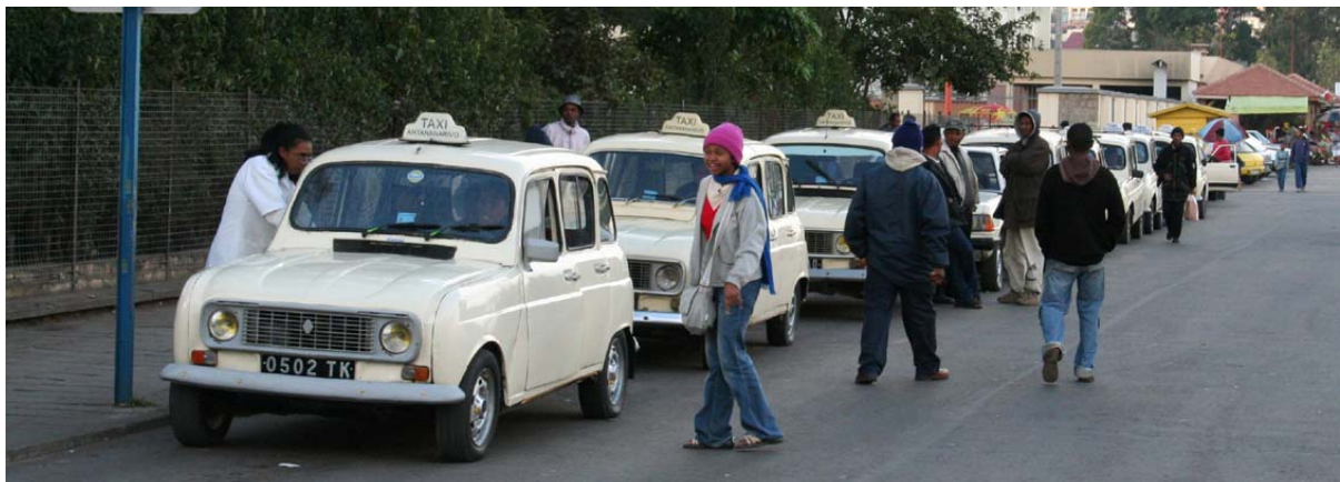
In den Städten sind selbstverständlich auch normale Taxi – sehr häufig R 4 – im Einsatz

▶ Siehe auch unter „ Abkürzungen/Symbole “ – Taxi-Brousse-Station, unter „ Autofahren “, unter „ Distanz- und Fahrzeit-Tabellen “, unter „ Glossar “ – Taxi-Brousse, unter „ Hotely “, unter „ Infrastruktur “ – Tankstellen , unter „ Mora-Mora “, unter „ Orte-Info-Blätter “ – Ambositra (Foto Modell in Holz), unter „ Ortschaften “ – Ambondromamy , Port Bergé , unter „ Preise “ – Taxi-Brousse, unter „ Safety First “, unter „ Sitten und Gebräuche “, unter „ Souvenirs “ – Spielzeugautos (Modell eines Taxi-Brousse in Metall), unter „ Städte “ – Antananarivo (Foto), unter „ Stadtpläne “, unter „ Strassenverhältnisse “ und unter „ Verkehrsmittel “ – Busse , Personenautos .