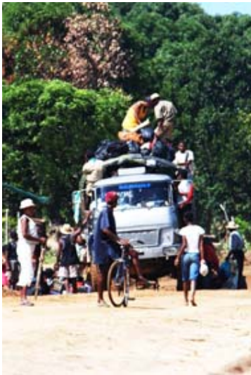
LKW beim Beladen ( RN 5a )...