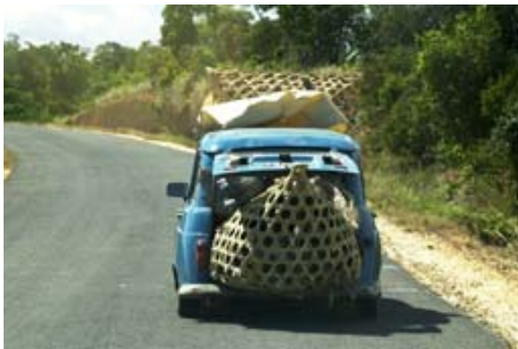
4 L – Renault mit Passagieren und Hühnern

Oft hören wir den Hinweis, dass zu einem Aufenthalt in Madagaskar unbedingt auch eine Fahrt im Taxi- Brousse gehöre. Darüber lässt sich in guten Treue streiten. Natürlich lernt man bei einer solchen Fahrt die Mitfahrer besser kennen, als wenn man im bequemen Geländewagen das Land erkundet. Aber: Die Taxi-Brousses sind chronisch überladen, es ereignen sich immer wieder schwere Unfälle und gemeinsam mit Menschen , die meist nicht französisch sprechen und oft nach unseren Begriffen über eine unangenehme Ausdünstung verfügen, allenfalls noch mit viel Gepäck zu reisen ist nicht Jedermanns Sache. Wenn man aber eine Fahrt trotzdem plant, sollte man das Ticket bereits am Vortag beschaffen und pro Person zwei Plätze bezahlen, so kann man, sofern der Fahrer das akzeptiert, für sich mindestens den normalen Platz für eine Person in Anspruch nehmen.