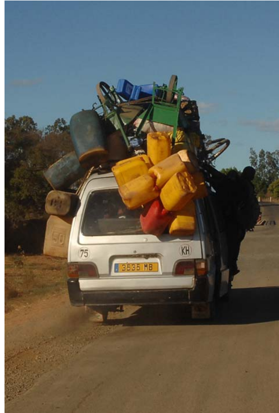
Gut beladen und wer keinen Platz findet, hängt sich einfach an die Türe