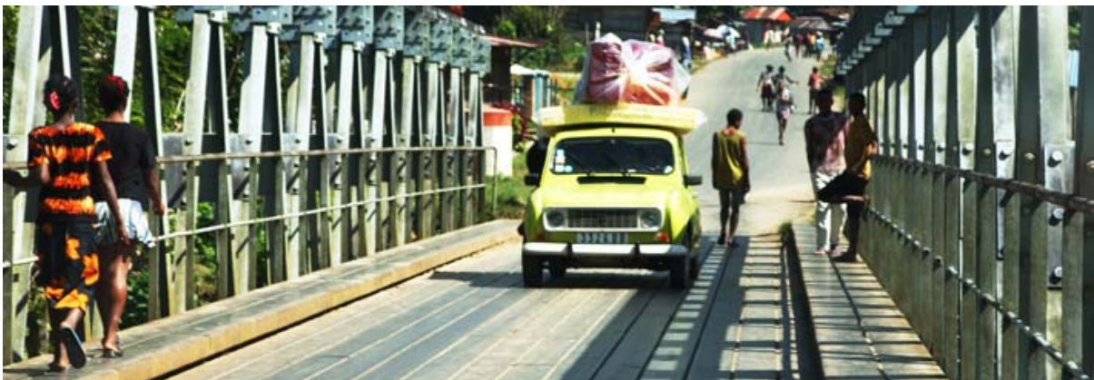
Häufig fahren auch Renault 4L über grössere Strecken