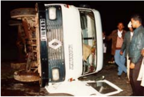
Verkehrsunfälle – insbesondere bei Fahrten...