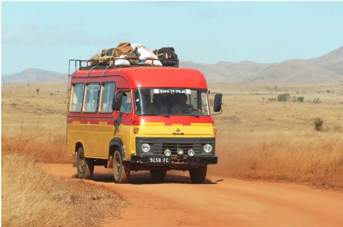
Auf der RN 13 zwischen Betroka und Ihosy