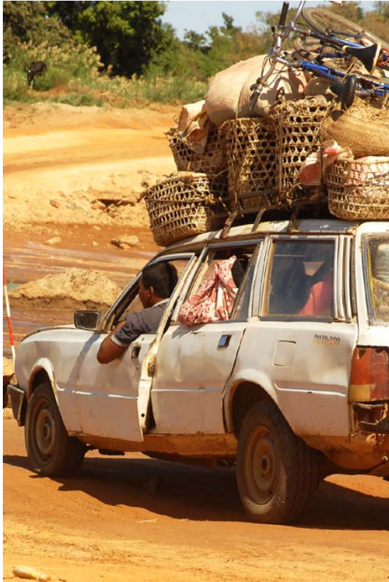
Die Türe wird beim Fahren mit dem Arm gehalten