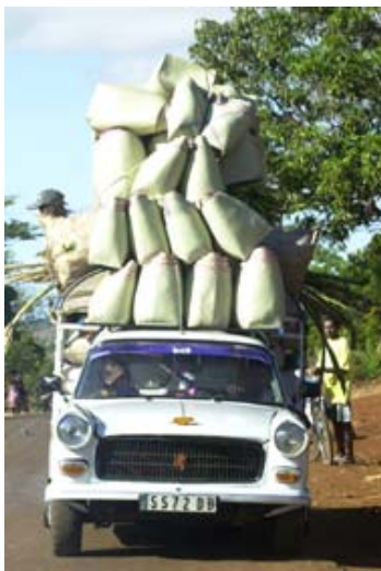
Noch ein Sack bitte!