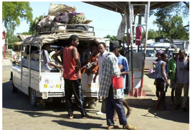
An der Tankstelle in Maevatanana