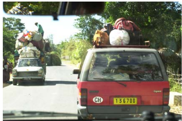
Mini-Bus importiert aus der Schweiz