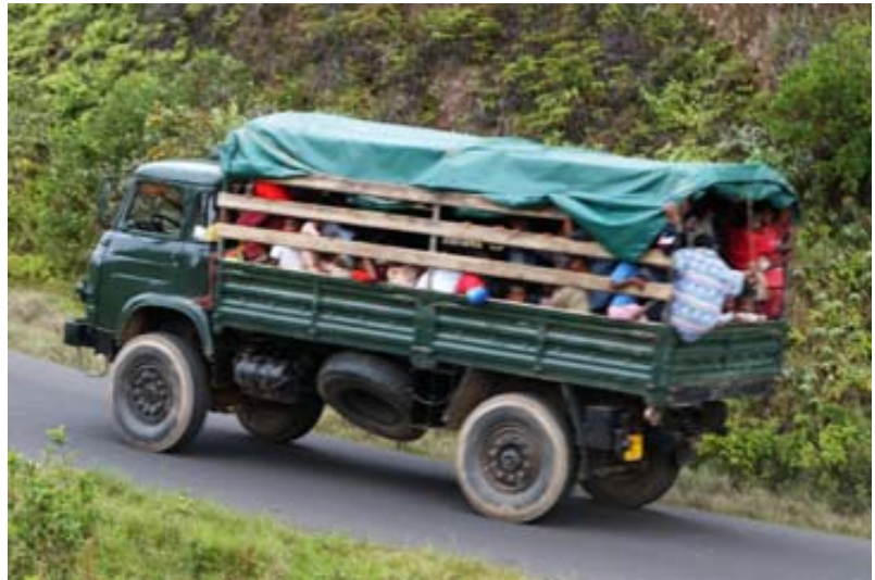
...und bei voller Fahrt auf der RN 3b