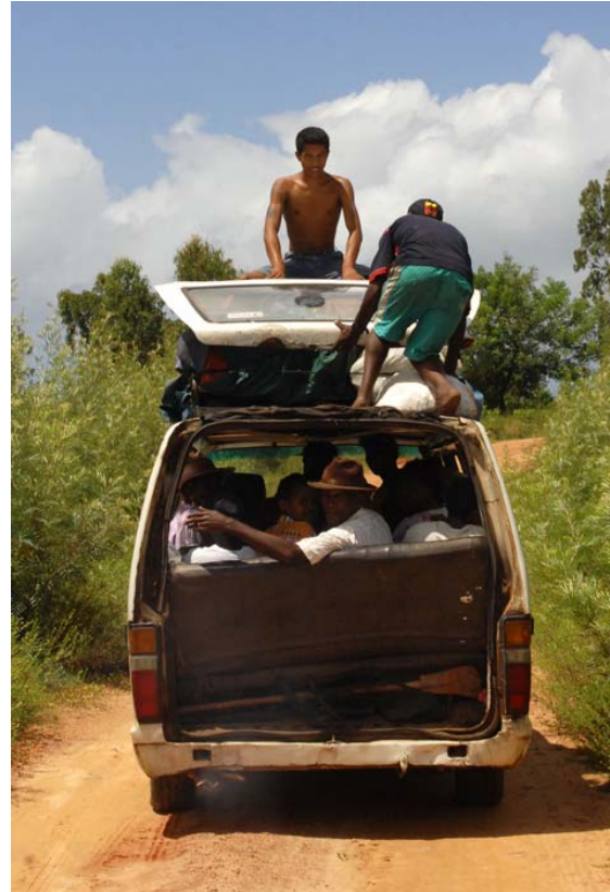
Der Bus verlor vor uns seine Hecktüre