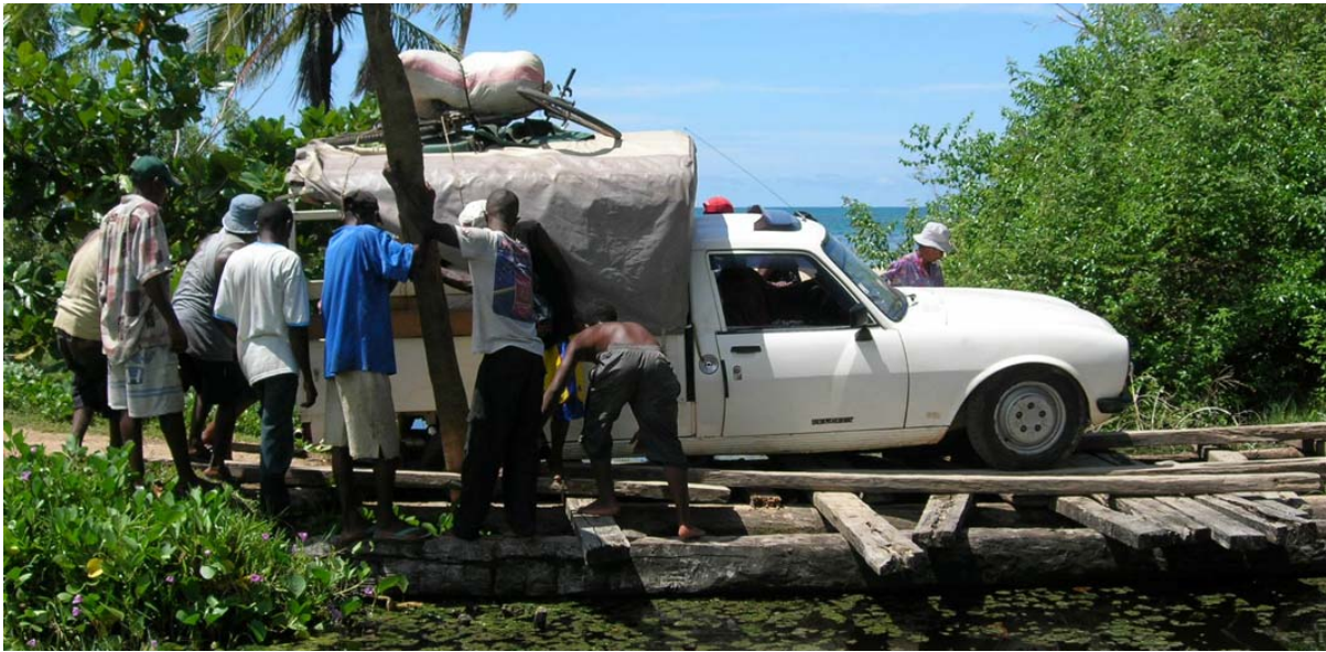
Auf morscher Brücke eingebrochener Taxi-Brousse zum Cap Est ( Trekking – Masoala )